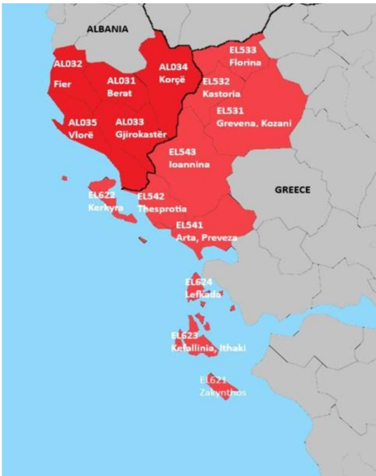
Εικόνα 1: Η επιλέξιμη περιοχή του προγράμματος

Η επιλέξιμη περιοχή του προγράμματος, όπως απεικονίζεται στον παραπάνω χάρτη, περιλαμβάνει 12 περιφερειακές ενότητες από την ελληνική πλευρά (Γρεβενά, Κοζάνη, Καστοριά, Φλώρινα, Άρτα, Πρέβεζα,