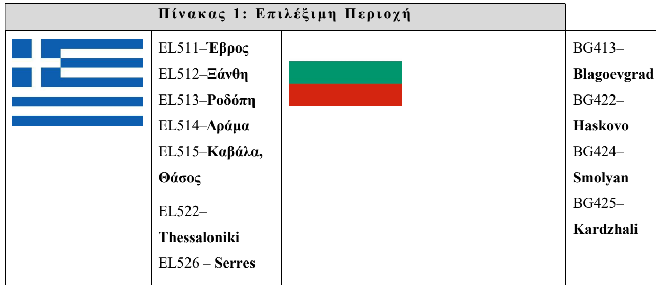
Πίνακας 1: Επιλέξιμη Περιοχή

και Θεσσαλονίκη της Περιφέρειας Κεντρικής Μακεδονίας Τέσσερις (4) βουλγαρικές Περιφέρειες: Μπλαγκόεβγκραντ της Νοτιοδυτικής Περιφέρειας, Χάσκοβο, Σμόλιαν, Κάρτζαλι της Νοτιοκεντρικής Περιφέρειας.